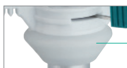
Cône en silicone