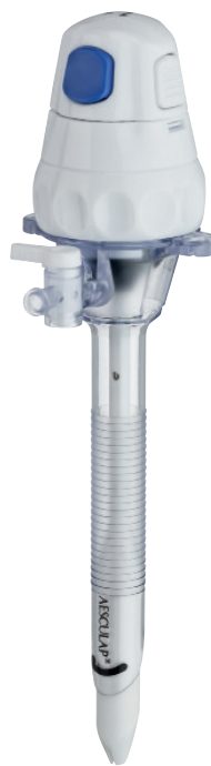
TROCARTS À LAME SÉCURISÉE