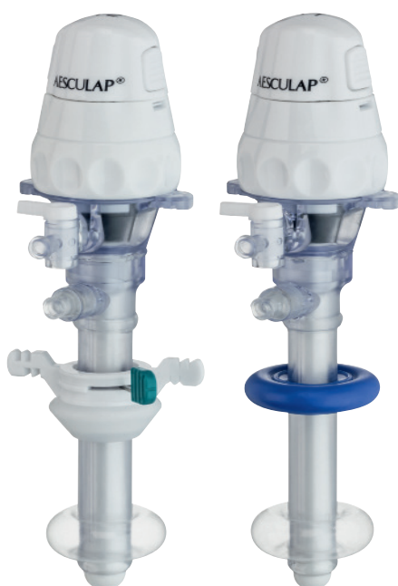
TROCARTS HASSON À BALLONNET