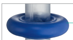
Anneau en élastomère thermoplastique