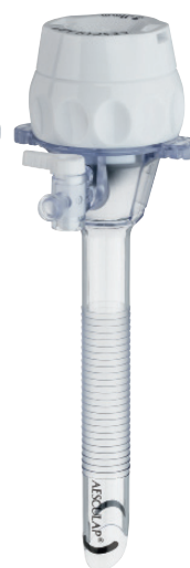
TROCARTS TRANSPARENTS À BALLONNET