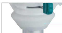
Cône en silicone