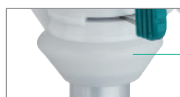
Cône en silicone