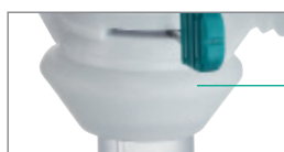
Cône en silicone