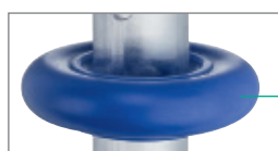
Anneau en élastomère thermoplastique