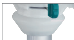
Cône en silicone