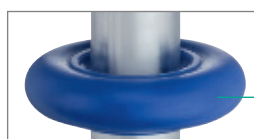
Anneau en élastomère thermoplastique