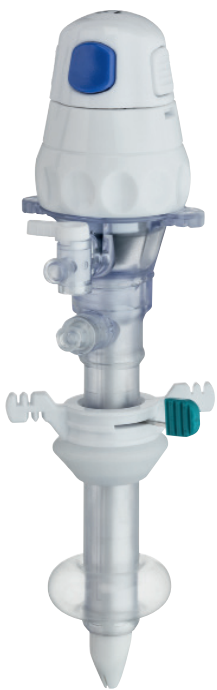
TROCARTS À LAME SÉCURISÉE À BALLONNET