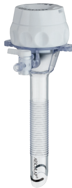
CHEMISES DE TROCARTS À BALLONNET