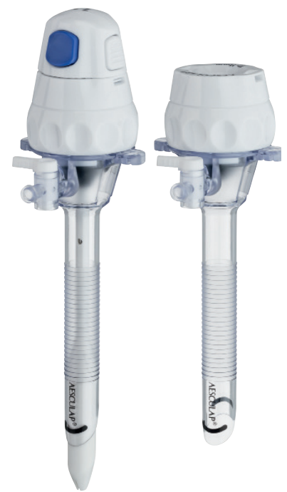
SETS DE TROCARTS À LAME SÉCURISÉE